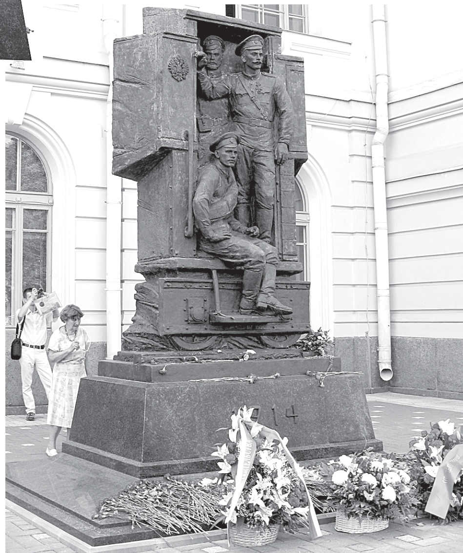
С фронта скульптуры — момент отправки гвардейцев.

ПАМЯТНИК ПЕРЕД ВИТЕБСКИМ ВОКЗАЛОМ ВЫПОЛНЕН В СТУДИИ ВОЕННЫХ ХУДОЖНИКОВ ИМЕНИ М. Б. ГРЕКОВА МИНИСТЕРСТВА ОБОРОНЫ РФ. ПЕТЕРБУРЖЦЫ УВИДЕЛИ В НЕМ ПЕРЕКЛИЧКУ СО «СТЕРЕГУЩИМ»