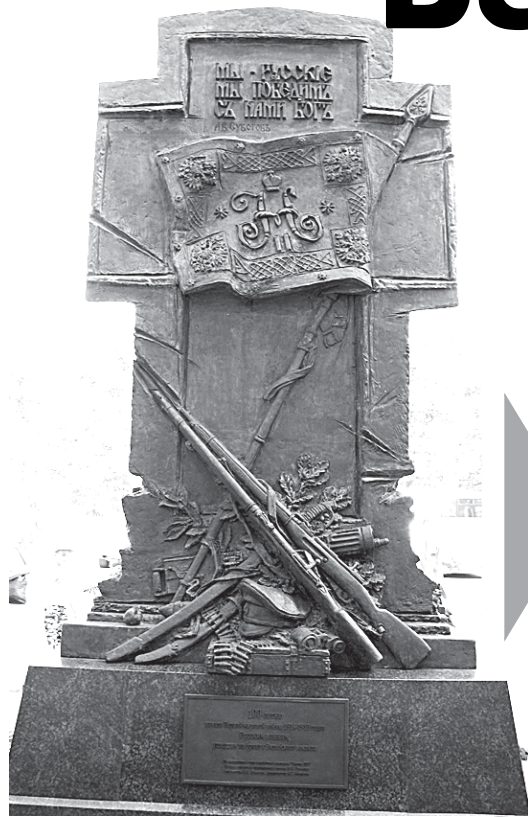
С тыла памятника — слова Суворова.

Как мы уже сообщали, скульптурная группа, посвященная Первой мировой войне, прибыла в Петербург из Москвы. Она изготовлена на средства спонсора — крупной строительной компании. Памятник выполнен в форме бронзового креста, стилизованного под те вагоны, в которых бойцов доставляли к театру боевых действий. Место размещения выбрано историческое: в годы Первой мировой войны с Царского вокзала, ныне Витебского, уходили воинские эшелоны.