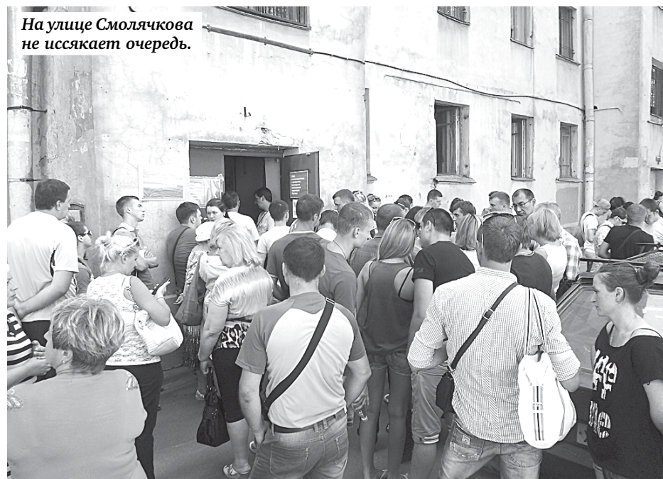
На улице Смолячкова не иссякает очередь.