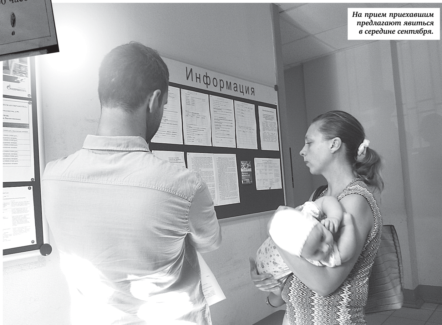
На прием приехавшим предлагают явиться в середине сентября.