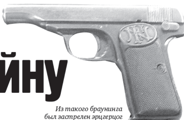
Из такого браунинга был застрелен эрцгерцог Франц Фердинанд.

Сто тысяч только британских голубей погибло на Западном фронте. Немцы против голубей противника использовали специально обученных соколов. У России тоже были свои военные почтари, доставлявшие «голубеграммы».