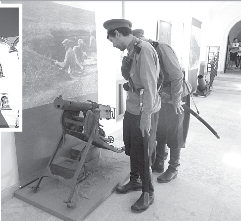
В экспозиции представлены все ключевые моменты войны.

ЗА ГОД УДАЛОСЬ СОБРАТЬ ЭКСПОЗИЦИЮ МУЗЕЯ, КОТОРЫЙ ОТКРЫЛСЯ В РАТНОЙ ПАЛАТЕ В ЦАРСКОМ СЕЛЕ