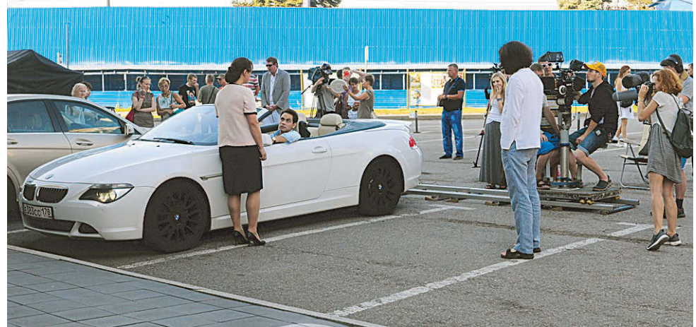
Первые кадры фильма снимались на проспекте Добролюбова.