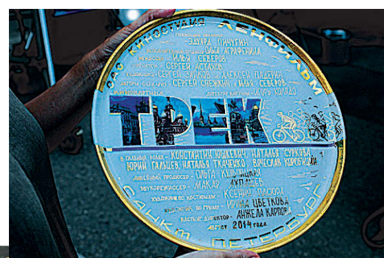
Такая красивая тарелка! Даже жалко разбивать...