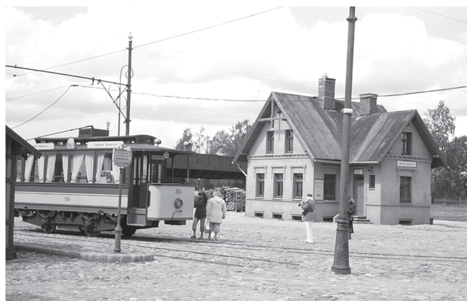
Недалеко от Риги для съемок исторического фильма о событиях вековой давности построили декорации — каким выглядел город в начале XX века. Сейчас этот бутафорский городок стал популярным музеем.