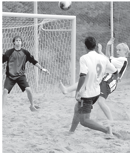
В пляжный футбол по традиции играют босиком.

В июне петербургская команда привезла из Италии победу на соревнованиях «Euro Winners Cup». Полтавченко поздравил команду с успешным выступлением и