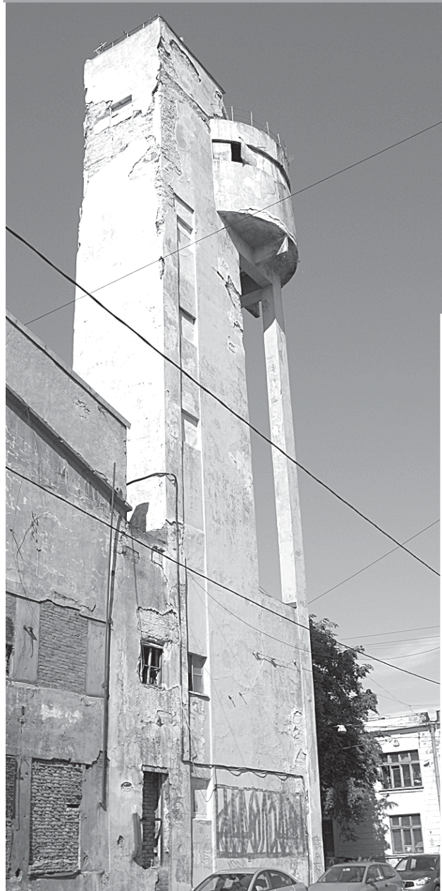
Авангардная башня на Васильевском острове — новый объект культурного наследия.

А ЗАВОДУУПРАВЛЕНИЕ ЗАВЕСИЛИ ПОРТРЕТОМ СТАЛИНА — ДО ПРЕВРАЩЕНИЯ В ЖИЛУЮ НЕДВИЖИМОСТЬ АРХИТЕКТУРА ПРОМЫШЛЕННОГО ЛЕНИНГРАДА ПОСЛУЖИТ ДЕКОРАЦИЕЙ ДЛЯ КИНО