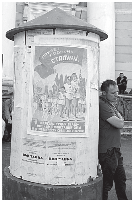
На съемках фильма о послевоенном Ленинграде перед бывшим заводоуправлением «Красного гвоздильщика» (Сталепрокатного завода).

Кроме канатного цеха и башни, из всех построек бывшего «Красного гвоздильщика» законом охраняется также угловое здание заводоуправления на пересечении 25-й и Косой линий. Это трехэтажное зда-