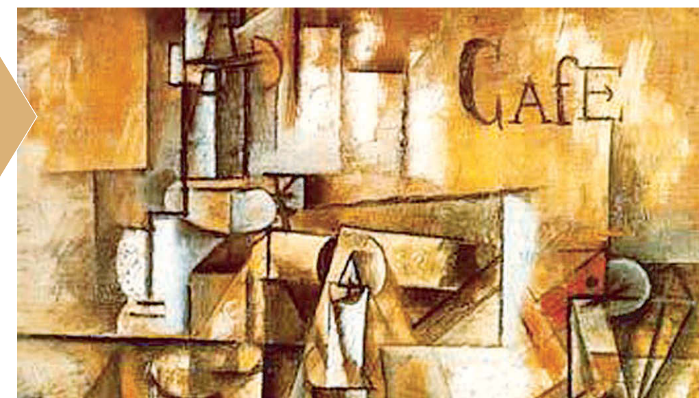
Голубь с зеленым горошком (фрагмент). Пикассо.

Этим кражам несть числа. Напомним об одной из самых странных. Ранним утром 20 мая 2010 года из парижского Музея современного искусства было украдено пять картин. В том числе картина Пабло Пикассо «Голубь с зеленым горошком». На месте преступления полиция обнаружила разбитое окно и сломанный замок. На кадрах с видеокамеры было видно, как вор, действующий в одиночку, быстро вытащил картины из рам. Его нашли довольно скоро — в 2011 году. Однако картины не вернулись в музей. На допросах он уверял, что выбросил картины в мусор сразу после кражи, поскольку запаниковал. Так или иначе, но картины пока не найдены.