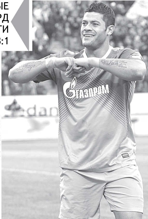
Халк сумел забить и с пенальти, и с игры.

Кстати, на отсутствие болельщиков на трибунах, вы-