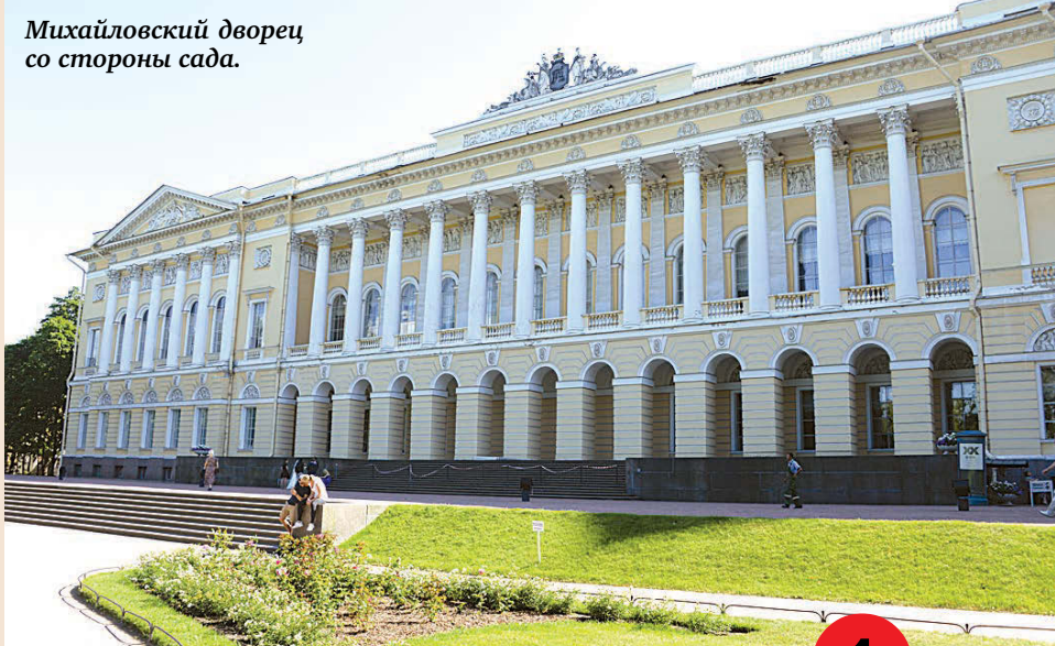
Михайловский дворец со стороны сада.

Корреспонденты «ВП» прогулялись в выходной по садам, расположенным в самом центре Петербурга, и составили их рейтинг.