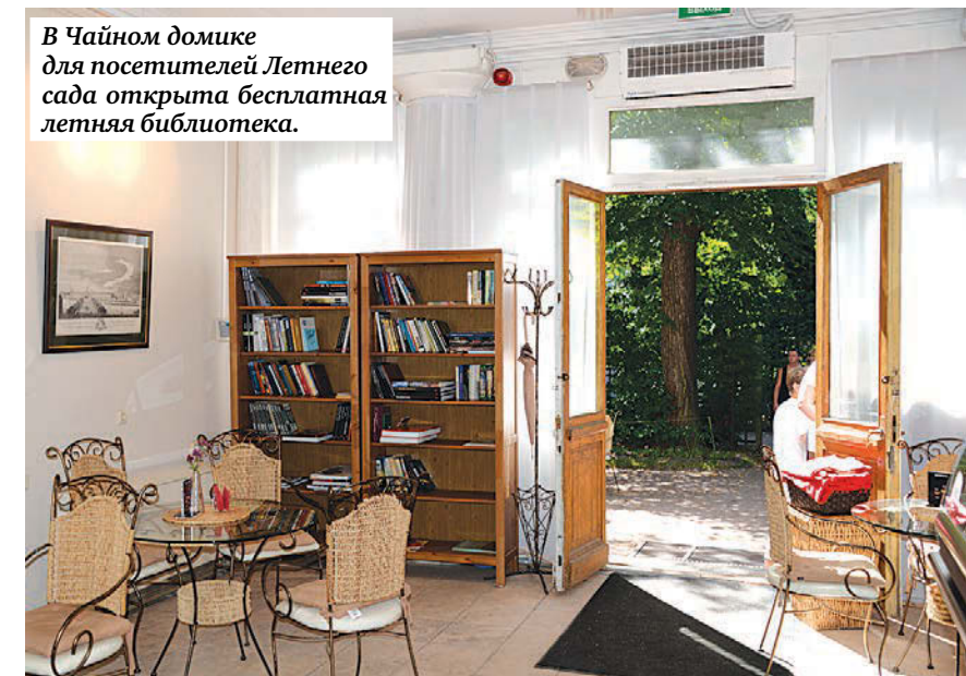
В Чайном домике для посетителей Летнего сада открыта бесплатная летняя библиотека.

И напоследок — о прозе жизни. Туалет, расположенный в монструозном хозблоке серого цвета, стал платным. Простят, правда, недорого — 20 рублей.