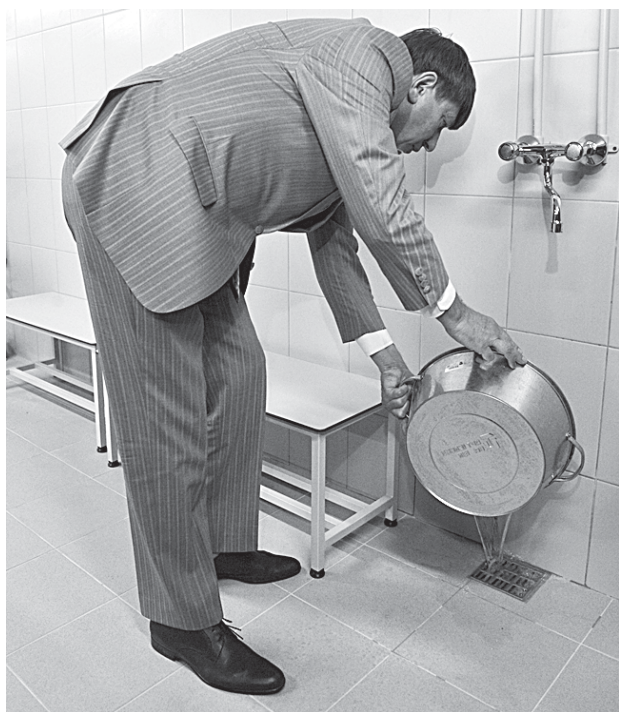
Глава Петроградского района тщательно изучал готовность важного для района объекта.

ВЛАДЕЛЬЦАМ ОСТАЛОСЬ ИСПРАВИТЬ ВЕНТИЛЯЦИЮ, ОБОРУДОВАТЬ МЕДПУНКТ И ЗАВЕЗТИ МЕБЕЛЬ