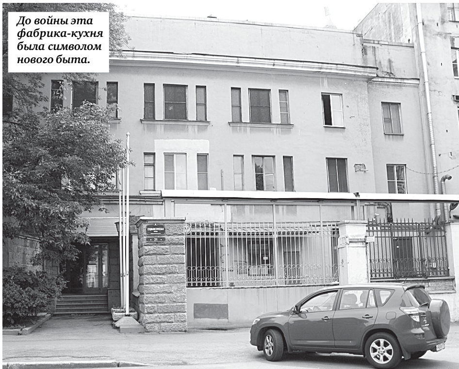
До войны эта фабрика-кухня была символом нового быта.

Новые частные владельцы (компания «Оркла Брэндс Россия») заявили о новых