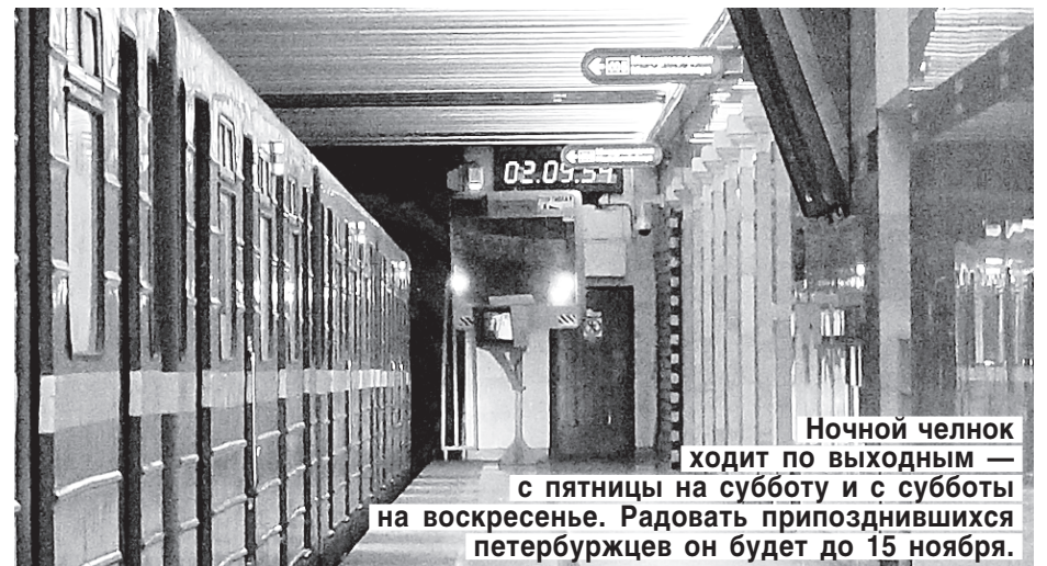
Ночной челнок ходит по выходным — с пятницы на субботу и с субботы на воскресенье. Радовать приподнявшихся петербуржцев он будет до 15 ноября.

По его словам, когда поезд подходит, люди начинают ломиться внутрь, другие пассажиры выбраться не могут, состав ходуном ходит. Или отправка: слова «Осторожно, двери закрываются!» — как будто сигнал ускориться и бежать в отходящий поезд. С колясками, с сумками, с маленькими детьми за руку. Хотя следующий придет через 2 — 3 минуты. Лет 10 назад такого не было. Каждый боится куда-то опоздать!..