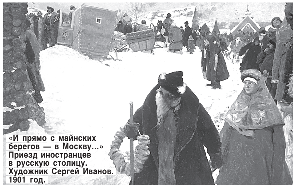
«И прямо с майнских берегов — в Москву...» Приезд иностранцев в русскую столицу. Художник Сергей Иванов. 1901 год.