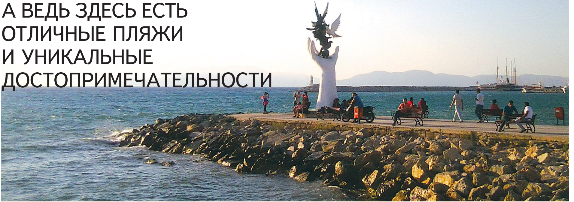
Кушадасы в переводе — «птичий остров». Главный городской монумент посвящен птицам.