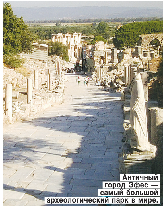
Античный город Эфес — самый большой археологический парк в мире.