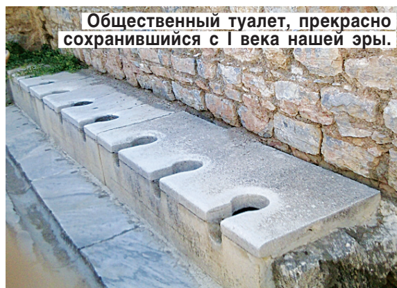
Общественный туалет, прекрасно сохранившийся с I века нашей эры.

Вот вы идете по плитам мраморной мостовой, уложенным более двух тысячелетий назад. На них сделаны зарубки, чтобы сандалии не скользили на отшлифованном мраморе. Вот мостик над торговой площадью, на которой продавали привезенные со всех концов света товары и рабов. За площадью высится отреставрированный фасад библиотеки. А если идти вверх по улице, то попадаешь в древнеримский общественный туалет. Его лишь слегка подреставрировали, а выглядит он будто вчера построенный. По словам экскурсовода, туалет для аристократов был местом общения, там играл оркестр и велись беседы на философские темы. К туалету примыкал публичный дом. В нескольких метрах от него обнаружен указатель в виде отпечатанной в мраморе ступни. Прекрасно сохранились и два театра: большой и малый. Удивительно, что и сегодня то, что говорит вполголоса человек, стоящий на сцене, можно слышать даже на самом последнем ряду, — такая уникальная здесь акустика. При раскопках найдено много статуй, но все они выставлены в краеведческом музее города Сельчук, который считается современным Эфесом.