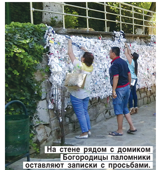
На стене рядом с домиком Богородицы паломники оставляют записки с просьбами.