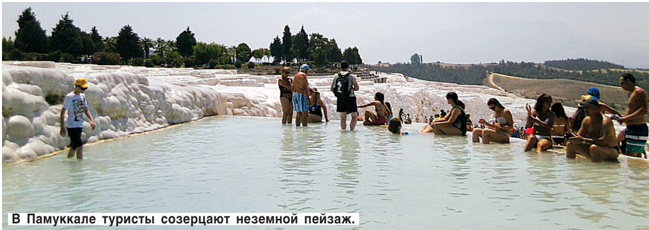
В Памуккале туристы созерцают неземной пейзаж.

Море и солнце — совсем не главное, что притягивает туристов в Кушадасы. Главное — уникальные природные и исторические памятники. И прежде всего — Памуккале.