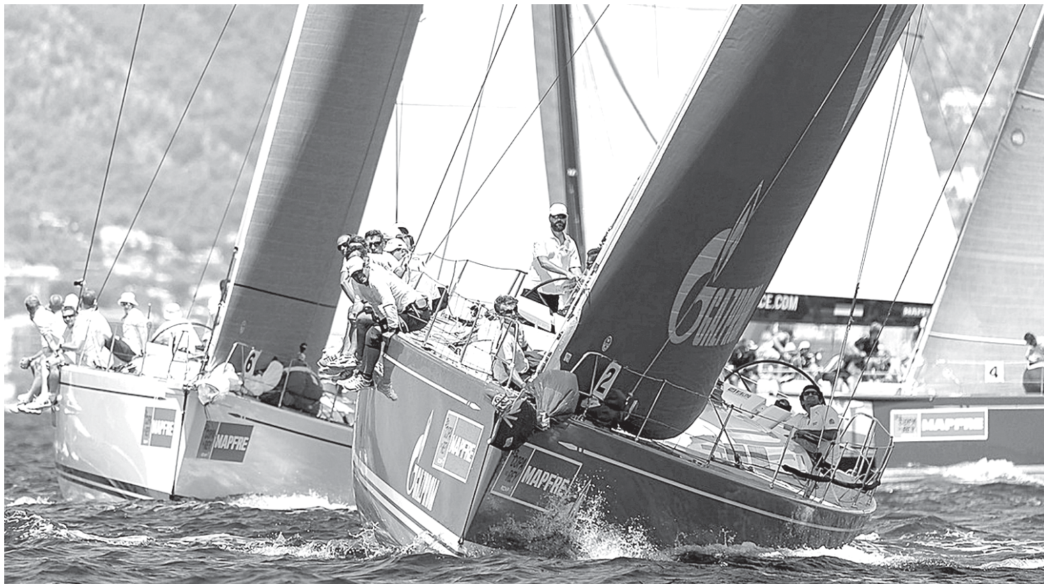
Гонка проходила в одном из самых живописных заливов Балеарских островов.