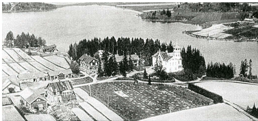
Так выглядело имение до революции...

нынешнее жаркое лето даже северное Приладожье стало отличным местом для отдыха петербуржцев — с купанием, загоранием, рыбалкой и дивной природой. ода в ладожских шхерах прогрелась до температуры Черного моря, а местные рыбаки потирают руки: на носу большой сезон судака! Но часто в карельских краях можно встретить и гостей из Финляндии. Это объяснимо: соседи любят так называемые ностальгические туры по местам бывших финских поселений.