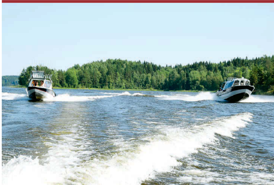
Прогулка по Ладожскому озеру — настоящее приключение.