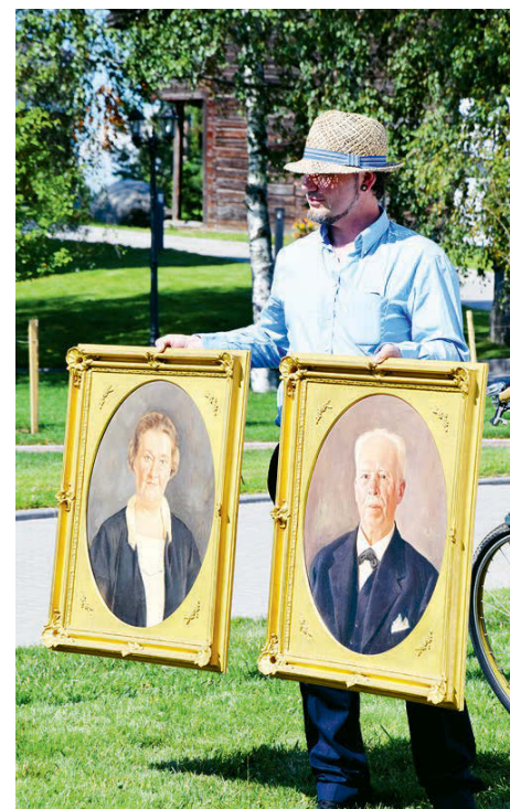
Портреты первых владельцев усадьбы — подарок Финляндии.