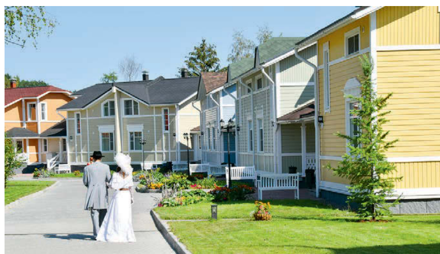
...а так — сегодня.