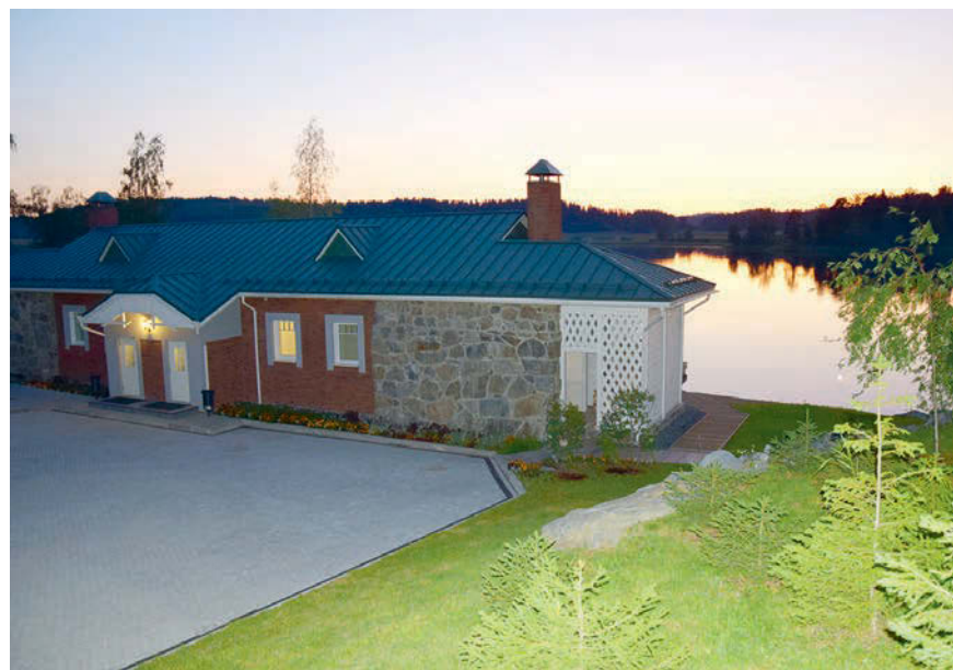
В шхерах Ладоги этим летом было едва ли не теплее, чем в южных морях.