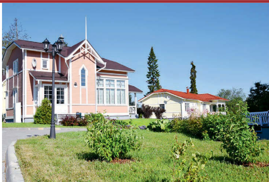
Финны приезжают в эти края за ностальгией.