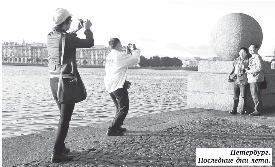
Петербург. Последние дни лета.