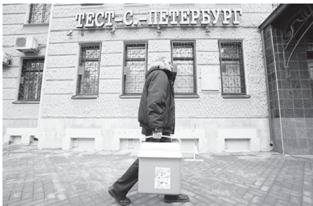
Продукты будут тестировать профессионалы.

Несмотря на то что организатором конкурса выступает общественная организация потребителей, оценку качества заявленных на конкурс товаров проводят спе-