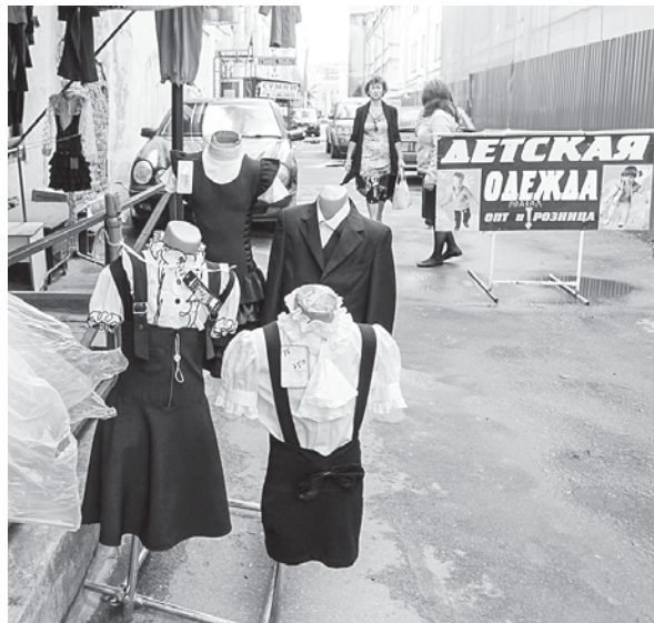
Школьных базаров в городе много, и выбор товаров большой.

— Многие родители, покупая форму, смотрят в первую очередь на цвет, на то, как сидит, а из чего сшита форма — не имеет значения, — рассказала заведующая магазином, торгующим формой из натуральных тканей. — Но форма из синтетики после первой же стирки потеряет вид, это в первых, во-вторых, в ней тело не дышит, случалось, дети падали в обморок, когда в школе было жарко. И стоит форма из натуральных тканей разве что на двести-триста рублей дороже. Правда, таких магазинов мало.