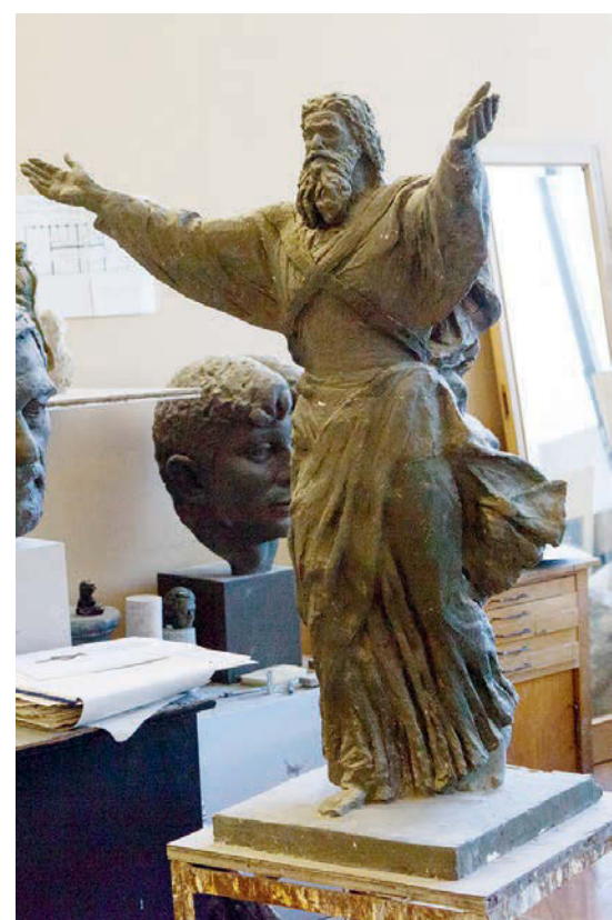
Гипсовая модель Андрея Первозванного.

Когда художник как хочет, так и уродует этот мир, то его искусство вызывает антипатию. Хотя и находятся те, кто себя уговаривает, мол, в этом что-то есть. Но надо всему