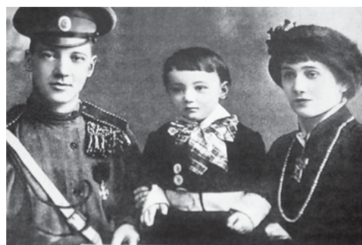
Николай Гумилев и Анна Ахматова с сыном Львом.

пропагандистским фильмам, а также редкие экспонаты — движущиеся карикатуры, значки благотворительных сборов, вырезные бумажные солдатики различных армий, обертки от шоколада с военно-патриотической тематикой.