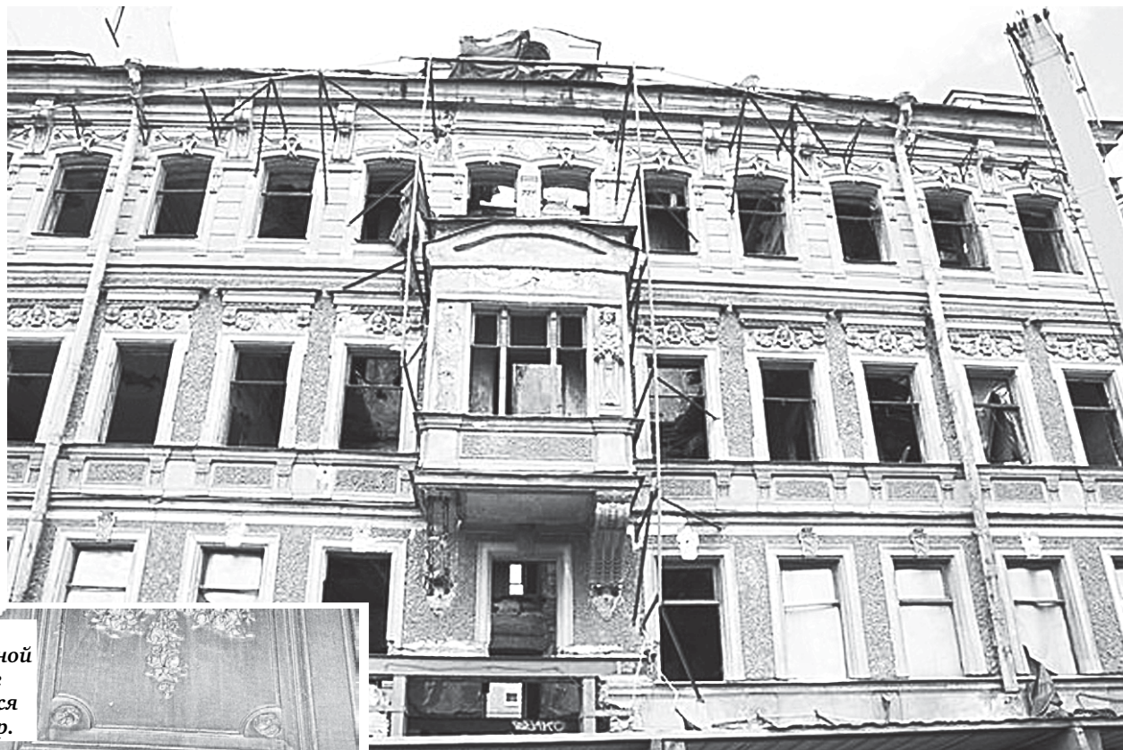
Декор на парадной лестнице сохранился до сих пор.