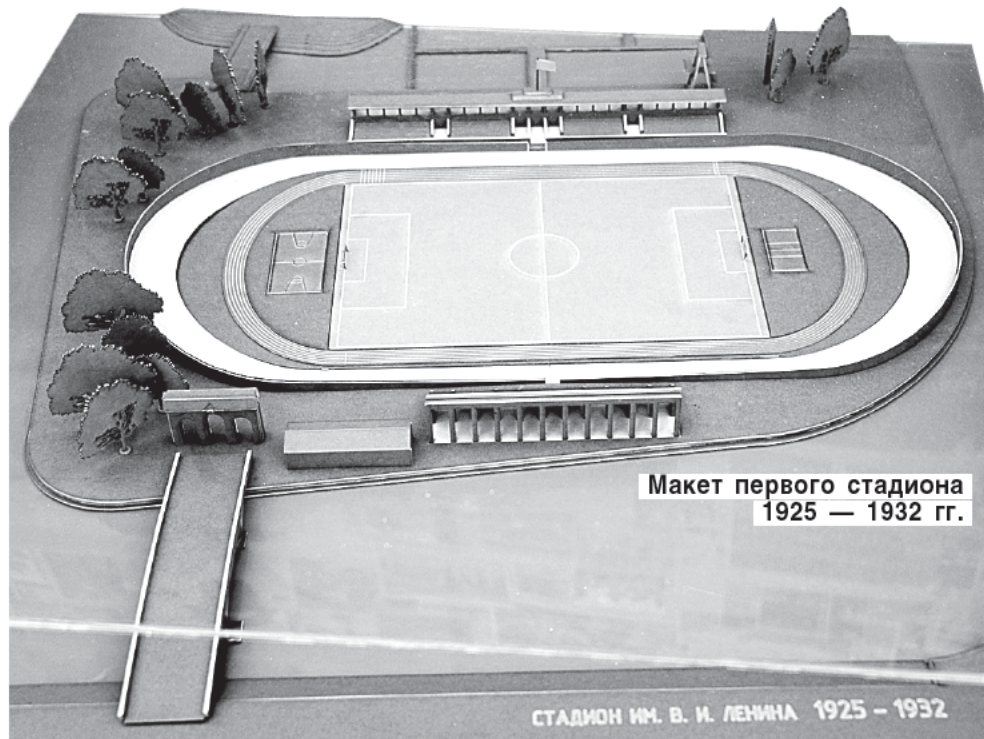
Макет первого стадиона 1925 — 1932 гг.