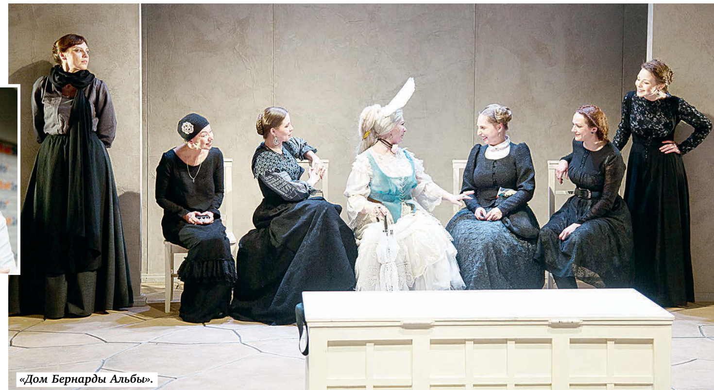
«Дом Бернарды Альбы».

В пьесе Сомерсета Моэма «Верная жена» речь идет, попросту говоря, об измене. Но мы подойдем к пьесе немножко с другой стороны. Порассуждаем о том, как человек по-