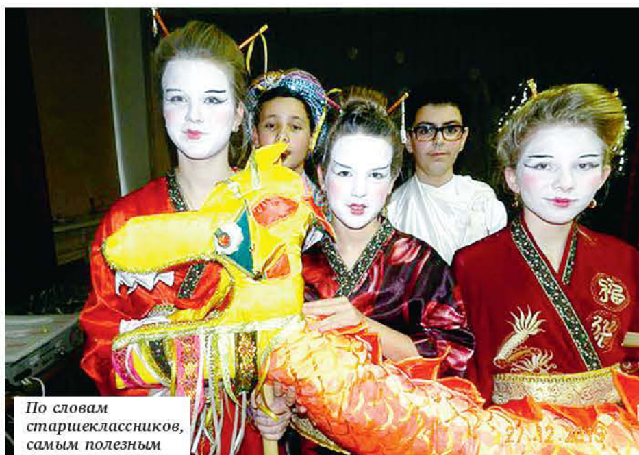
По словам старшеклассников, самым полезным нововведением в рамках нового курса могут стать театральные уроки.