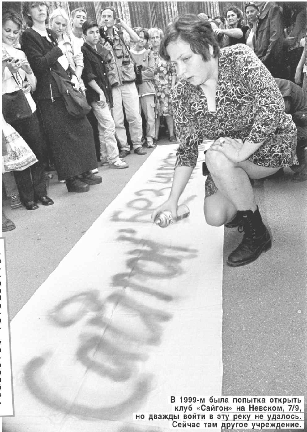
В 1999-м была попытка открыть клуб «Сайгон» на Невском, 7/9, но дважды войти в эту реку не удалось. Сейчас там другое учреждение.

— Кофе в «Сайгоне» — это наша молодость, это целая идеология: вроде и не хочется, а все равно берешь маленький двойной, самый крепкий! А сейчас это вспоминается, только когда с митьками собираемся. Тогда я пью такой же кофе, как раньше: настоящий крепкий эспрессо.