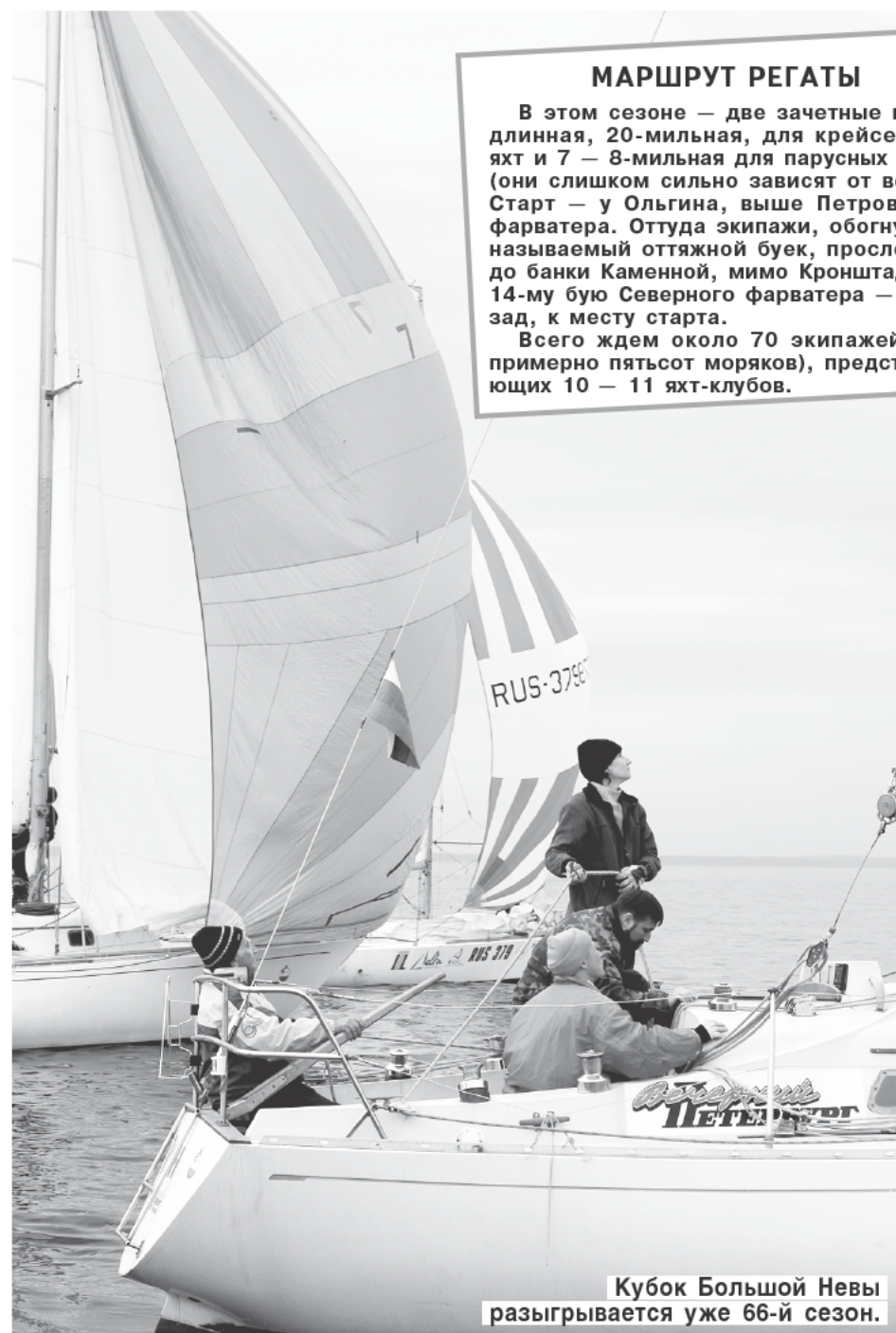
Кубок Большой Невы разыгрывается уже 66-й сезон.

Павел ВЛАДИМИРЦЕВ