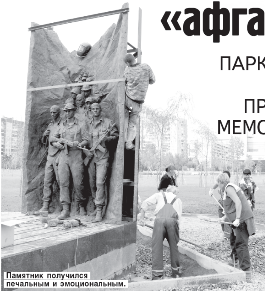
Памятник получился печальным и эмоциональным.