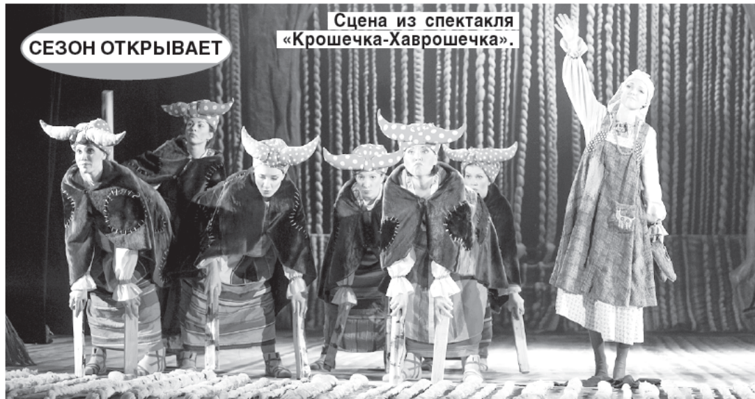
Сцена из спектакля «Крошечка-Хаврошечка».