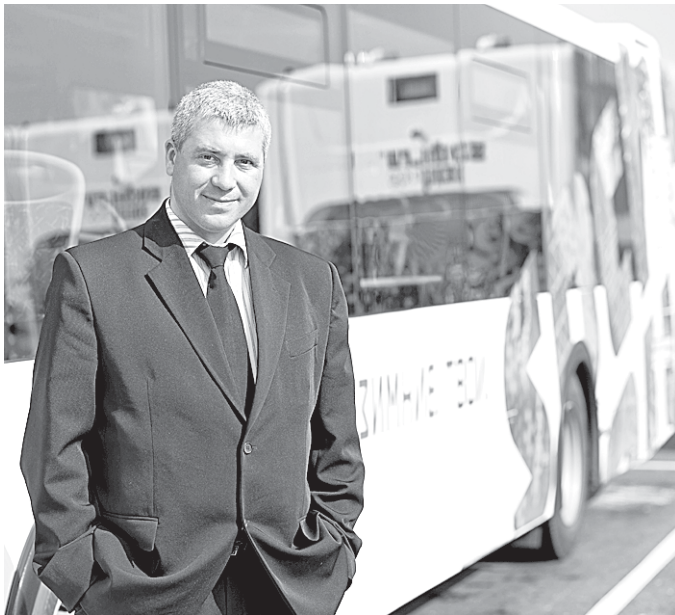
С таким водителем и дорога приятнее!

Кстати, у контролеров-кондукторов уже появились изменения во внешнем виде. Теперь они носят жилеты, на которых изображен забавный смайлик в водительской фуражке.