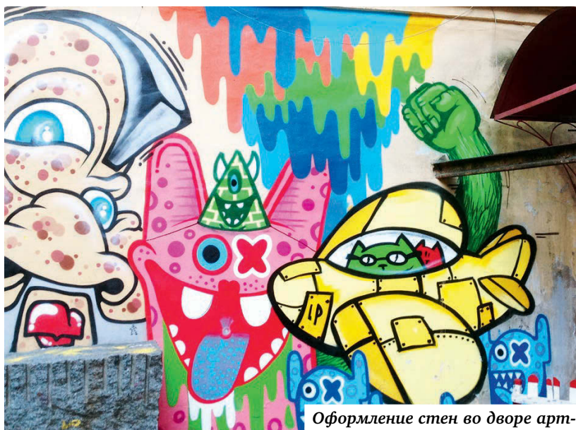
Оформление стен во дворе арт-пространства «Пушкинская 10».