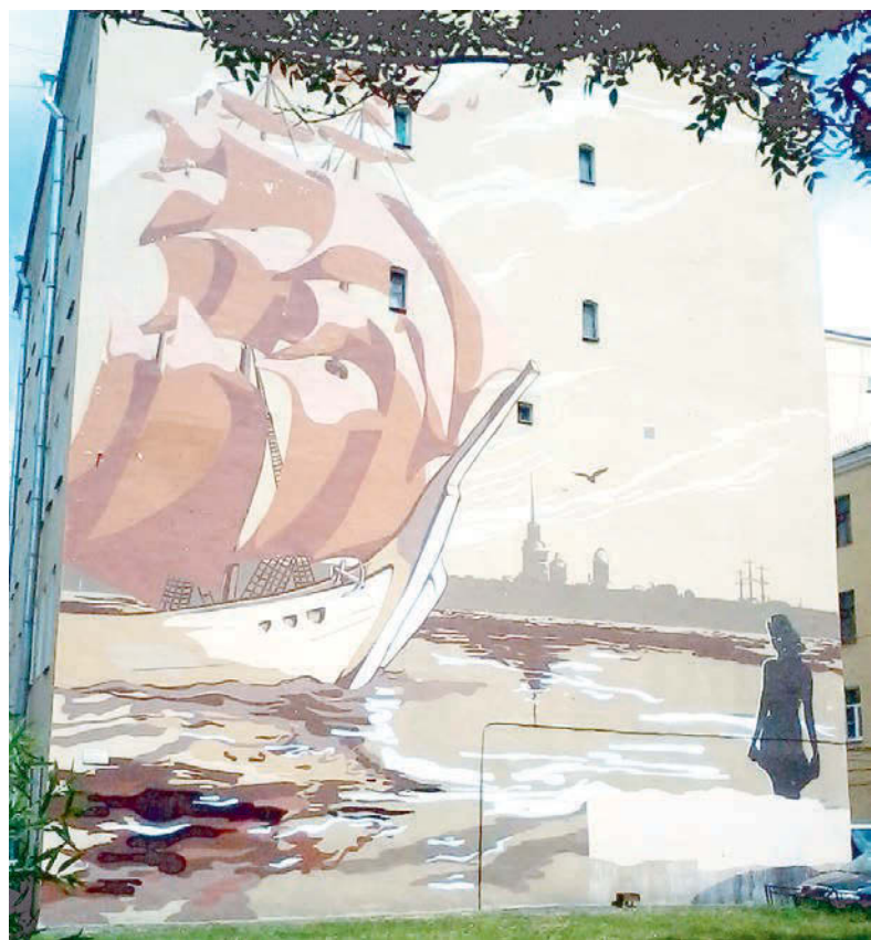
Доходный дом по адресу: Лиговский проспект, 1836.