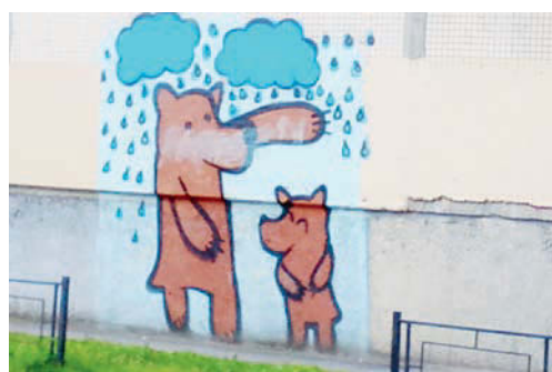
Стена жилой многоэтажки на проспекте Ударников.