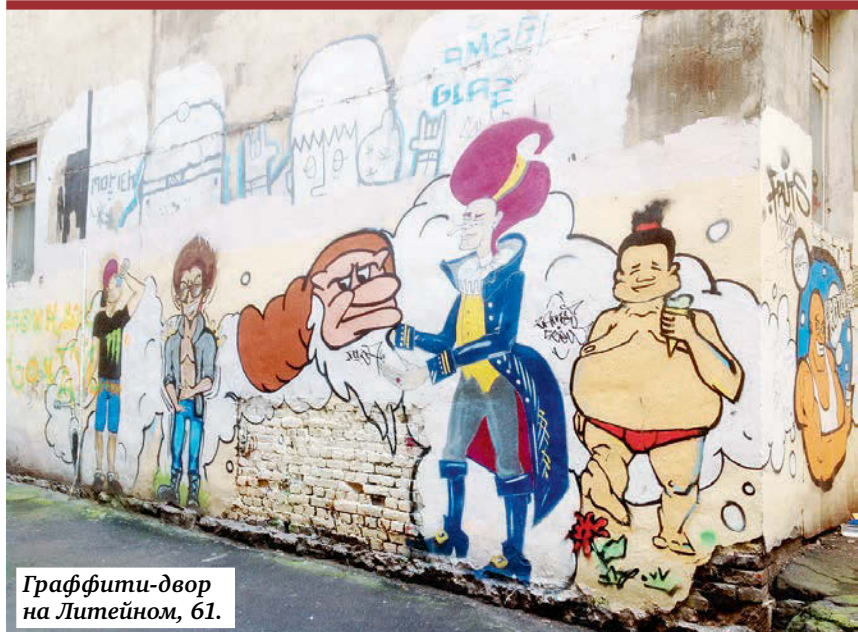
Граффити-двор на Литейном, 61.