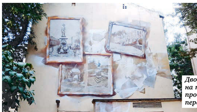
Двор арт-галереи на пересечении Невского проспекта и Перекупного переулка.

В последнее время в новостных лентах нашего города появляются сообщения о новых шедеврах уличных художников. Кто-то рисует черно-белые портреты знаменитостей на дебаркадерах, кто-то создает замысловатые надписи на гаражах, а кто-то во дворах устраивает настоящие картинные галереи. В нашем фоторепортаже вы можете увидеть, как сегодня реализуют свой творческий потенциал петербургские граффитисты.