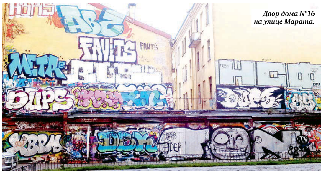
Двор дома №16 на улице Марата.