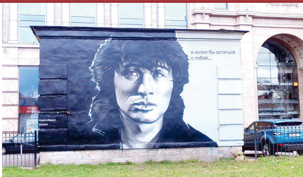
Портрет Виктора Цоя во дворе на улице Восстания.

В последнее время в новостных лентах нашего города появляются сообщения о новых шедеврах уличных художников. Кто-то рисует черно-белые портреты знаменитостей на дебаркадерах, кто-то создает замысловатые надписи на гаражах, а кто-то во дворах устраивает настоящие картинные галереи. В нашем фоторепортаже вы можете увидеть, как сегодня реализуют свой творческий потенциал петербургские граффитисты.