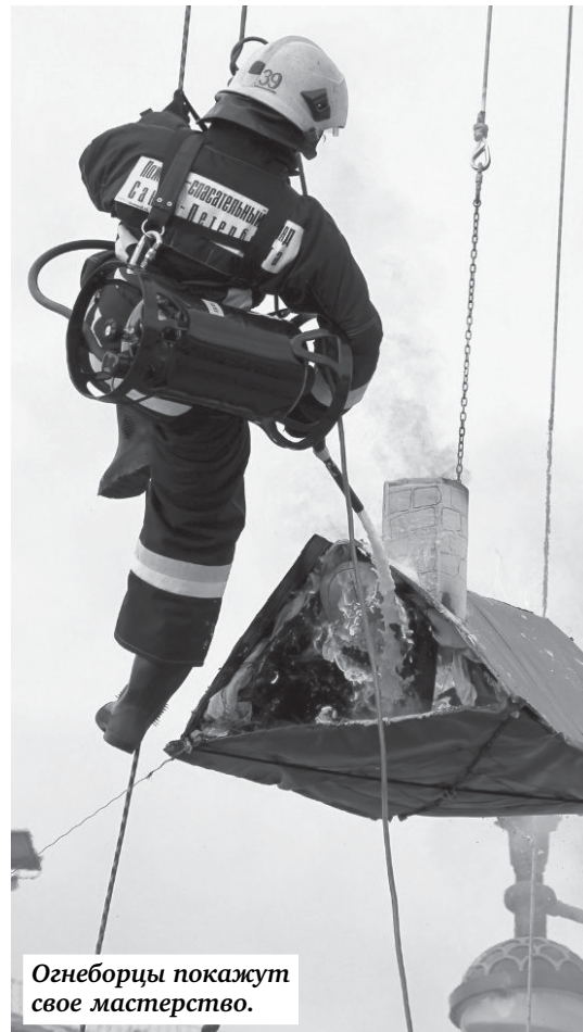
Огнеборцы покажут свое мастерство.

20 СЕНТЯБРЯ на Московской площади администрация Московского района, 7-й отряд федеральной противопожарной службы по Санкт-Петербургу, отдел надзорной деятельности Московского района и пожарно-спасательный отряд противопожарной службы по Московскому району при участии депутата Законодательного собрания Алексея Макарова проведут традиционный ежегодный праздник «День открытых дверей пожарной охраны Московского района».