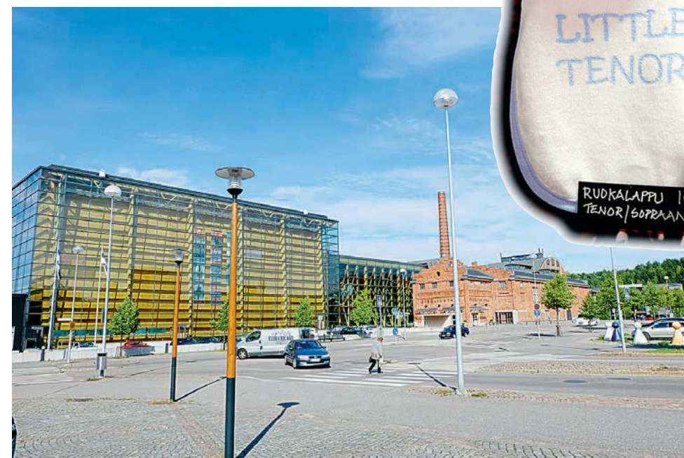
На месте Дома Сибелиуса раньше была фабрика, на которой обрабатывали древесину перед сплавом по озеру. Теперь это грандиозное сооружение из дерева, кирпича и стекла привлекает многих туристов из Финляндии и других стран.