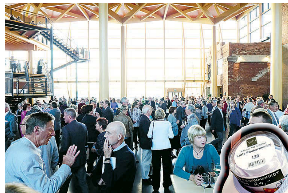
На концертах фестиваля Сибелиуса — аншлаги.