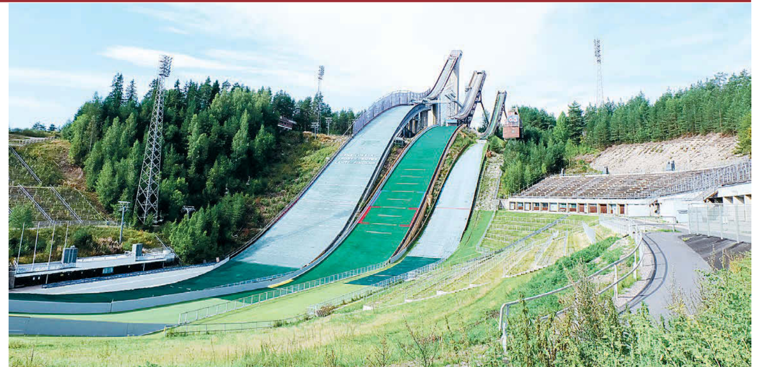
Лыжные трамплины Лахти.