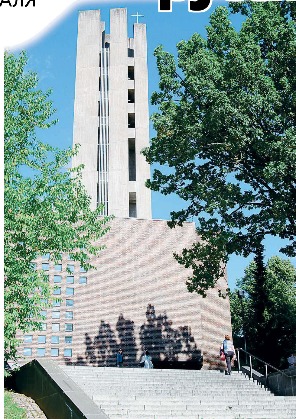
Церковь Креста (проект Алвара Аалто) поражает мощью и величием.

Лахтинские зимние игры не сразу приобрели такой размах. Но, с другой стороны, было бы странно, если бы было иначе. Спорт здесь культивируется как образ