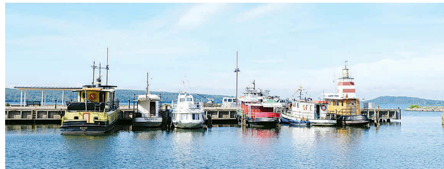
На берегу Весиярви.

Поклонников шершавого языка плаката заинтересует выставка, которая проходит раз в три года, и именно сейчас она открыта в городском музее. На конкурс было прислано около 2400 работ от почти 1500 дизайнеров со всего мира. Интернациональное жюри выбрало 330 плакатов