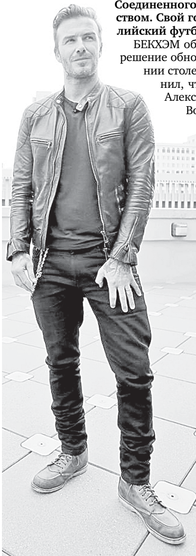
Дэвид Бекхэм надеется, что Шотландия останется в составе Соединенного Королевства. Своя сборная по футболу у нее есть, а что еще нужно?

Вот только обращение Бекхэма к чувствам футбольных болельщиков, иронически замечает таблоид «Дейли экспресс», может возыметь обратный результат. Ибо экс-капитан сборной Англии напомнил, что футболисты Великобритании на международных соревнованиях не выступают единой сборной, страна представлена отдельными сборными четырех ее исторических частей — в том числе и сборной Шотландии.