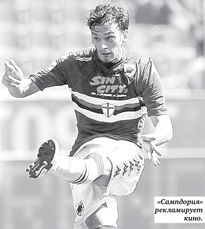
«Сампдория» рекламирует кино.