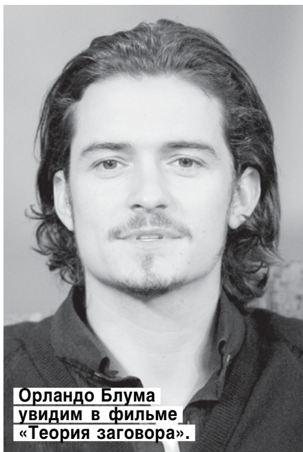
Орlando Блума увидим в фильме «Теория заговора».