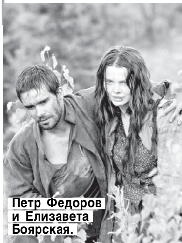
Петр Федоров и Елизавета Боярская.