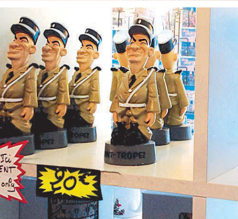
Сувениры из Сен-Тропе: фигурки жандарма Крюшо и вино.

В Сен-Тропе проживают всего четыре с половиной тысячи человек. Добраться до города весьма непросто — к нему ведут уз-