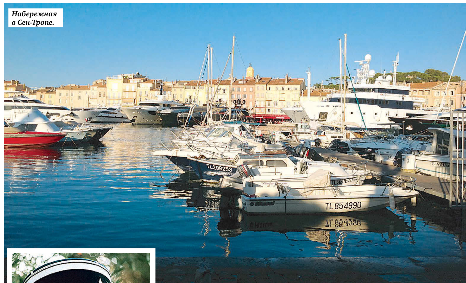
Набережная в Сен-Тропе.