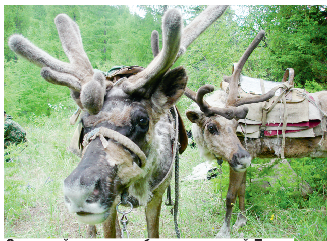
Северный олень — обитатель южной Тувы.

Современная история этой бывшей китайской колонии начинается как раз столетием назад. С падением династии Цин урянхайские (тувинские) князи-нойоны стали решать: как жить дальше? С монголами, с которыми — как «добрые» соседи — жили на ножах, решили не связываться. Попро-