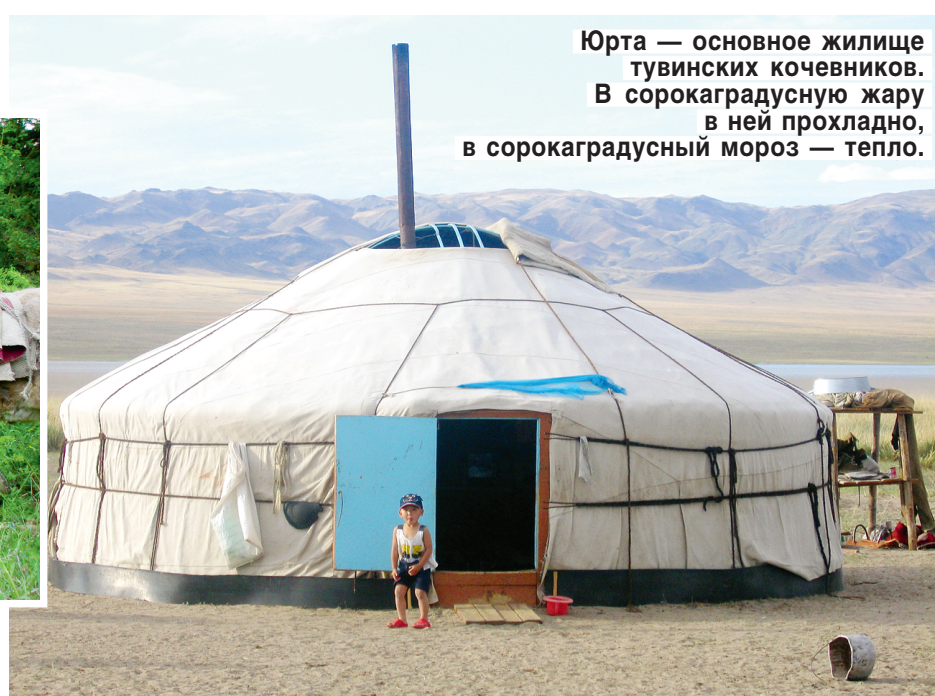
Юрта — основное жилище тувинских кочевников. В сорокаградусную жару в ней прохладно, в сорокаградусный мороз — тепло.

Справедливости ради стоит сказать, что именно в этот период тувинцы умудрились соткать из отдельных лоскутов неопишуемой красоты культурное одеяло. В Кызыле сегодня можно запросто увидеть семью, облаченную в национальные костюмы — расписные платья, остроносые шапки и сапо-