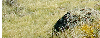
КОТ МАНУЛ, ЯК САРЛЫК, БАРС ИРБИС

Центр Азии — так говорят об этой республике. И неслучайно: географическая середина континента находится как раз поблизости от тувинской столицы — Кызыла.