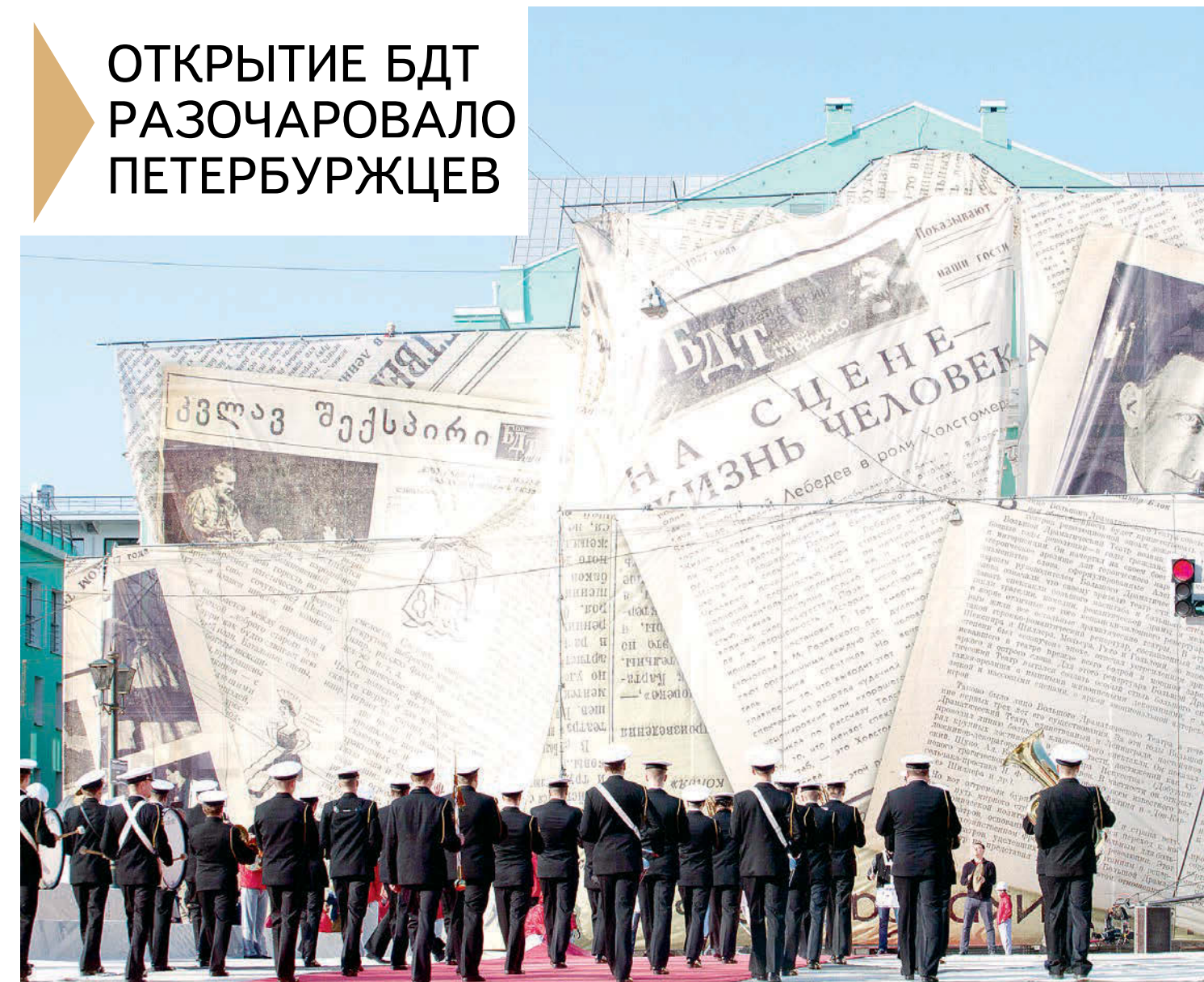
БДТ был «упакован» наподобие праздничного торта.

тов пропустили, а часть резко отстранили, хотя у них были такие же красивые карточки. Суровая охранница от БДТ, обнимая и пропуская знакомых, милостиво разрешила мне с московскими коллегами постоять перед дверьми, которые тотчас заперли со словами: «Ждите, и вам отворят». Мы ждали, но нам не отворили.