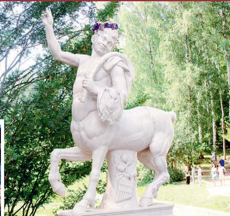
Кентавры много раз страдали от вандалов.