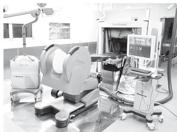
Такого томографа больше нет ни в одном центре России.

СЕГОДНЯ в Санкт-Петербургском клиническом научно-практическом онкоцентре в Песочном состоится запуск интраоперационного МРТ. Это самая современная модификация подобного томографа. Петербург стал первым в России городом, где появилось столь современное диагностическое оборудование. Томограф предназначен для работы во время проведения нейрохирургических вмешательств. Он позволяет отслеживать изменение формы и положения опухоли головного мозга у пациента непосредственно на операционном столе в режиме реального времени. Его применение позволит значительно повысить эффективность нейрохирургических вмешательств. А для злокачественных опухолей головного мозга именно операционное лечение — основное.