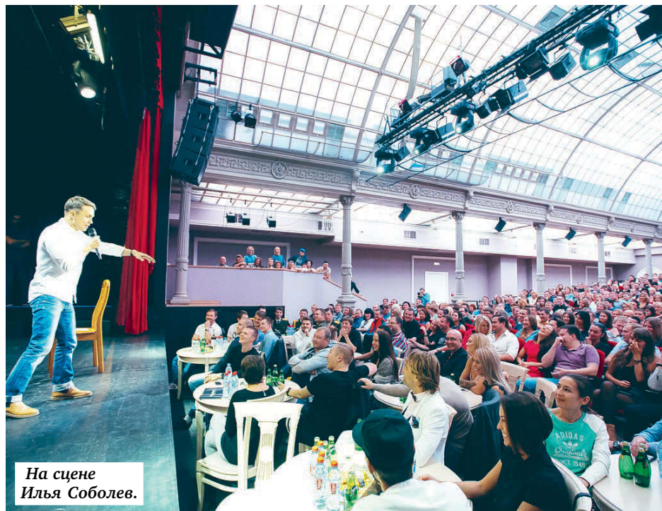
На сцене Илья Соболев.

НОВОСТЬ ДЛЯ ПОЧИТАТЕЛЕЙ «COMEDY CLUB»: НЫНЕШНЕЙ ОСЕНЬЮ В НАШЕМ ГОРОДЕ ОКОНЧАТЕЛЬНО СФОРМИРОВАН ФИЛИАЛ ЭТОГО КЛУБА ЮМОРИСТОВ