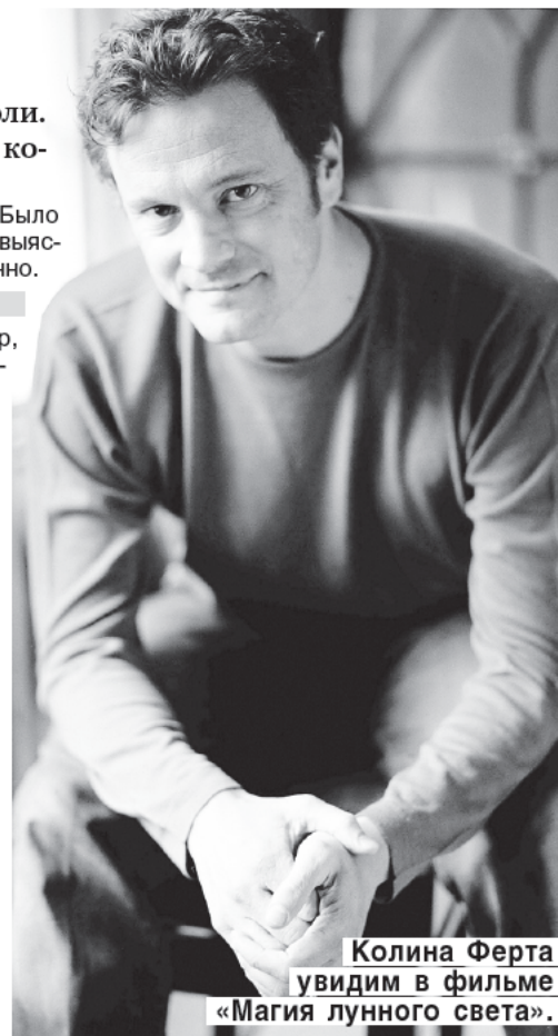
Колина Ферта увидим в фильме «Магия лунного света».

— Я поражен тем, насколько интересны роли, которые мне предлагают в последние годы. У фильмов, в которых я снимаюсь, при том что они разные, есть нечто общее. Они о человеке, который однажды решил, что жизнь — вот такая. А потом все меняется. Это означает, что даже в зрелые годы у тебя есть будущее и возможность перемен. Не думаю, что такие роли были мне доступны в двадцать лет. Ну и в 98 все будет совсем по-другому.