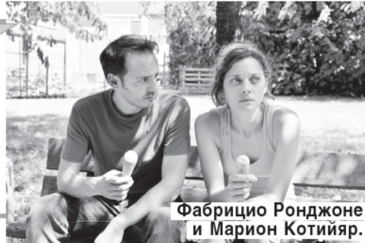
Фабрицио Ронджоне и Марион Котийяр.