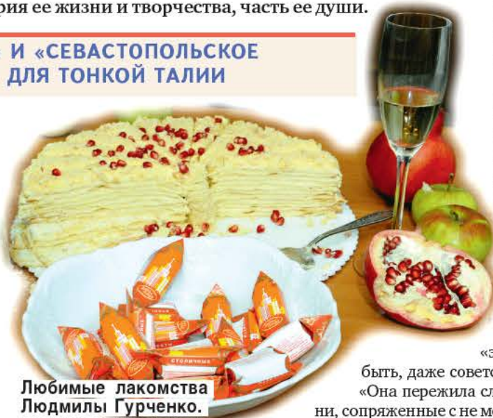
Любимые лакомства Людмилы Гурченко.