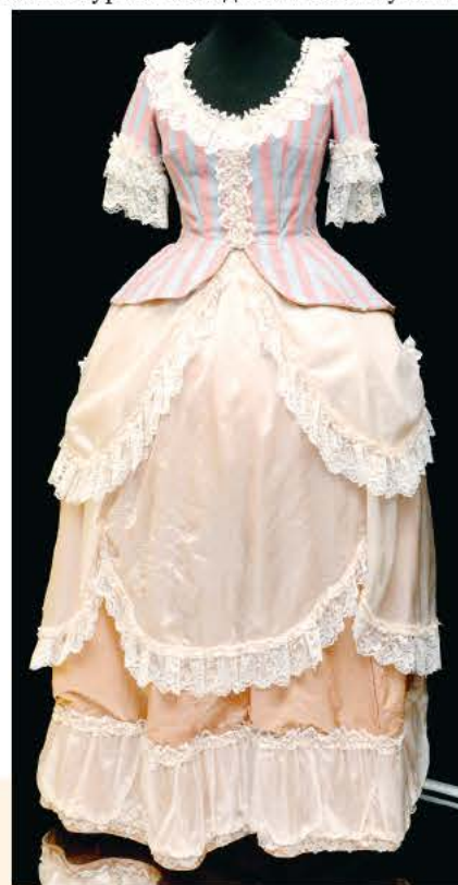
Платье Людмилы Гурченко для роли мадам Клары Бокардон («Соломенная шляпка»).

Ну а теперь вернемся к началу. На открытии выставки директор Музея театрального и музыкального искусства Наталья Метелица назвала Людмилу Гурченко «эталон русской и, может