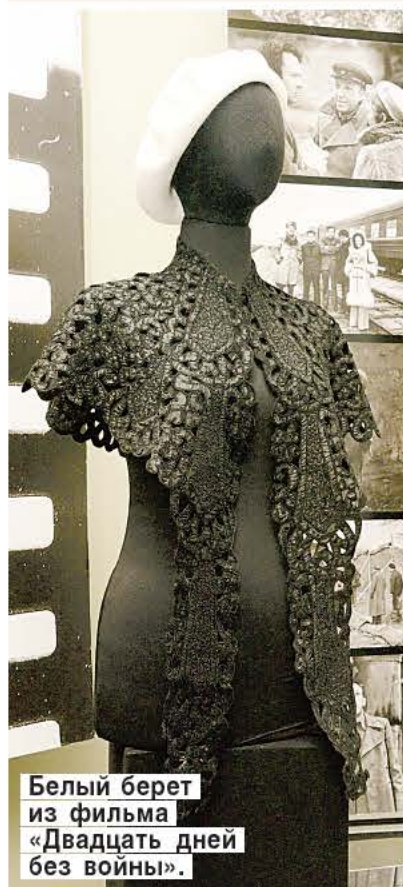
Белый берет из фильма «Двадцать дней без войны».