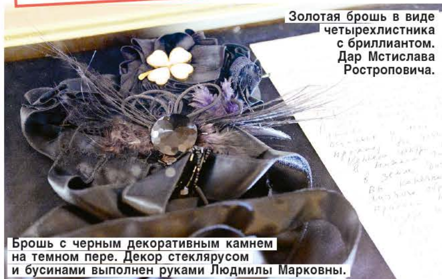
Брошь с черным декоративным камнем на темном пере. Декор стеклярусом и бусинами выполнен руками Людмилы Марковны.