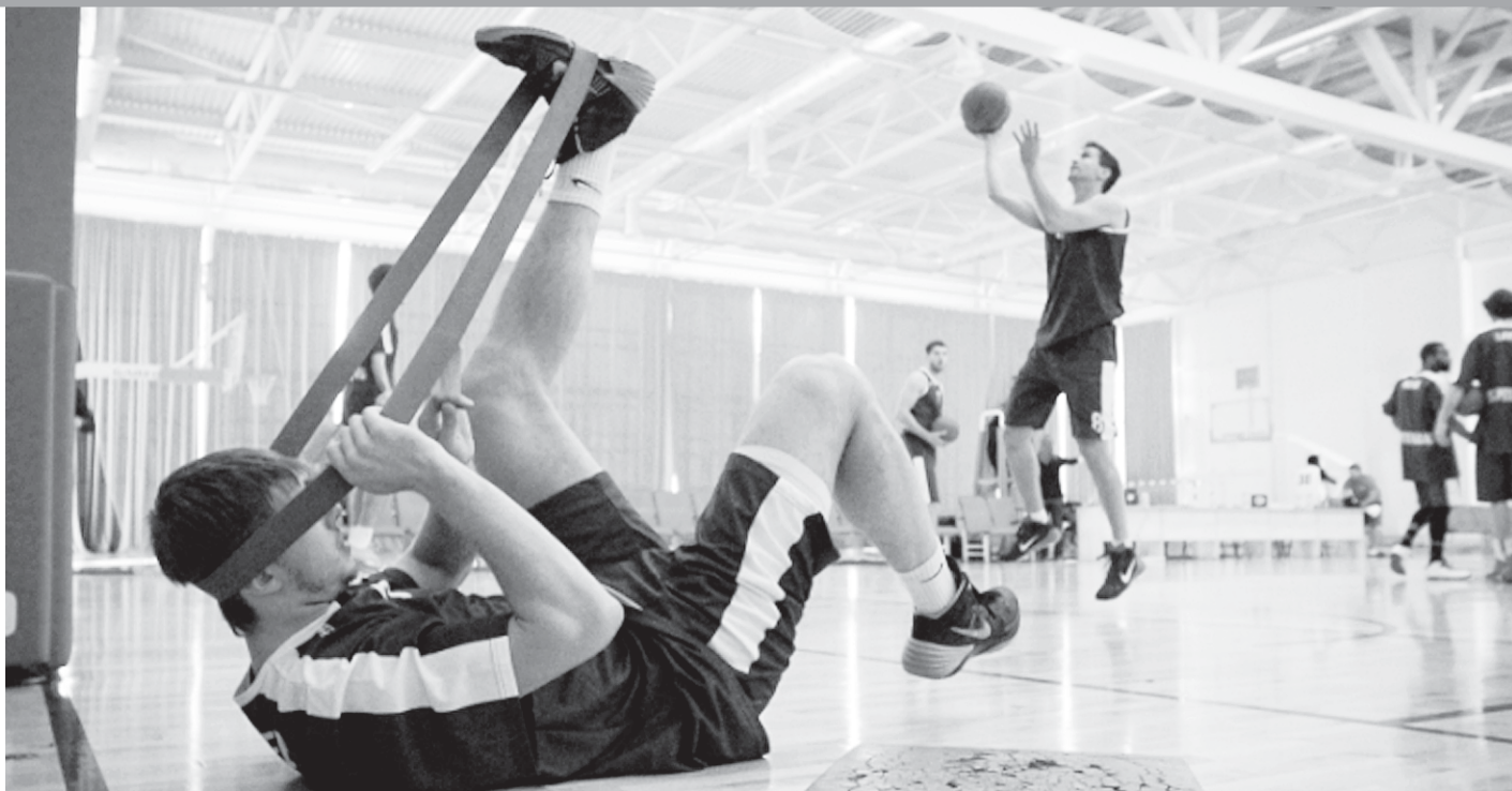
«Сибур-арена». Тренировка перед игрой.

Белые: Крд1, Фс7, Ке4, Кф6, п. d5 (5). Черные: Крf5, п. e6 (2). Мат в 3 хода.