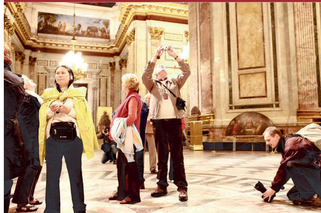
В номинации «Музей года» конкурентов у Исаакиевского собора не было.