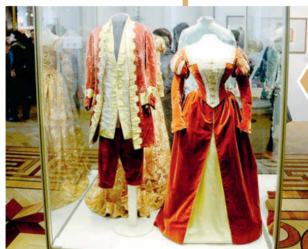
Выставка «Костюм XVIII — начала XX века в собрании Эрмитажа». Маскарадные костюмы для костюмированного бала в феврале 1903 года.

Государственный мемориальный музей обороны и блокады Ленинграда с книгой «Ленинградцы. Блокадные дневники из фондов музея», Музей Анны Ахматовой в Фонтанном доме с трехтомным каталогом «Иосиф Бродский. Фото-топись» и Военно-исторический музей артиллерии, инженерных войск и войск связи, которому удалось из материалов ныне практически никому не известной Трофейной комиссии создать книгу о героях Первой мировой войны, или, как мы снова говорим, Великой войны 1914 — 1918 годов. Все три проекта выполнены блестяще, и жюри предстоит нелегкий выбор.