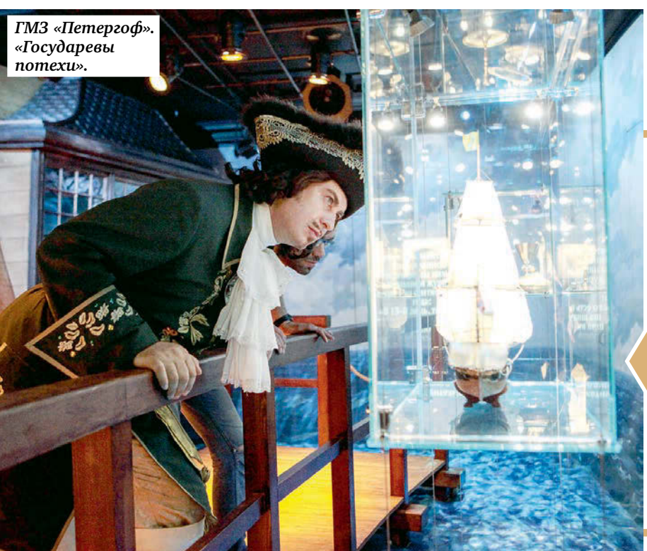
ГМЗ «Петергоф». «Государевы потехи».

Новый музей в Государственных ратных палатах ГМЗ «Царское Село», «Россия в Великой войне», необычный даже не музей, а историко-культурный проект «Петергофа» «Государевы потехи», где музейные предметы соседствуют с талантливыми дизайнерскими изобретениями и машинерией, а также новая экспозиция в Ризнице Спаса-на-Крови «Музей камня», которая создана специалистами Государственного музея-памятника «Исаакиевский собор».