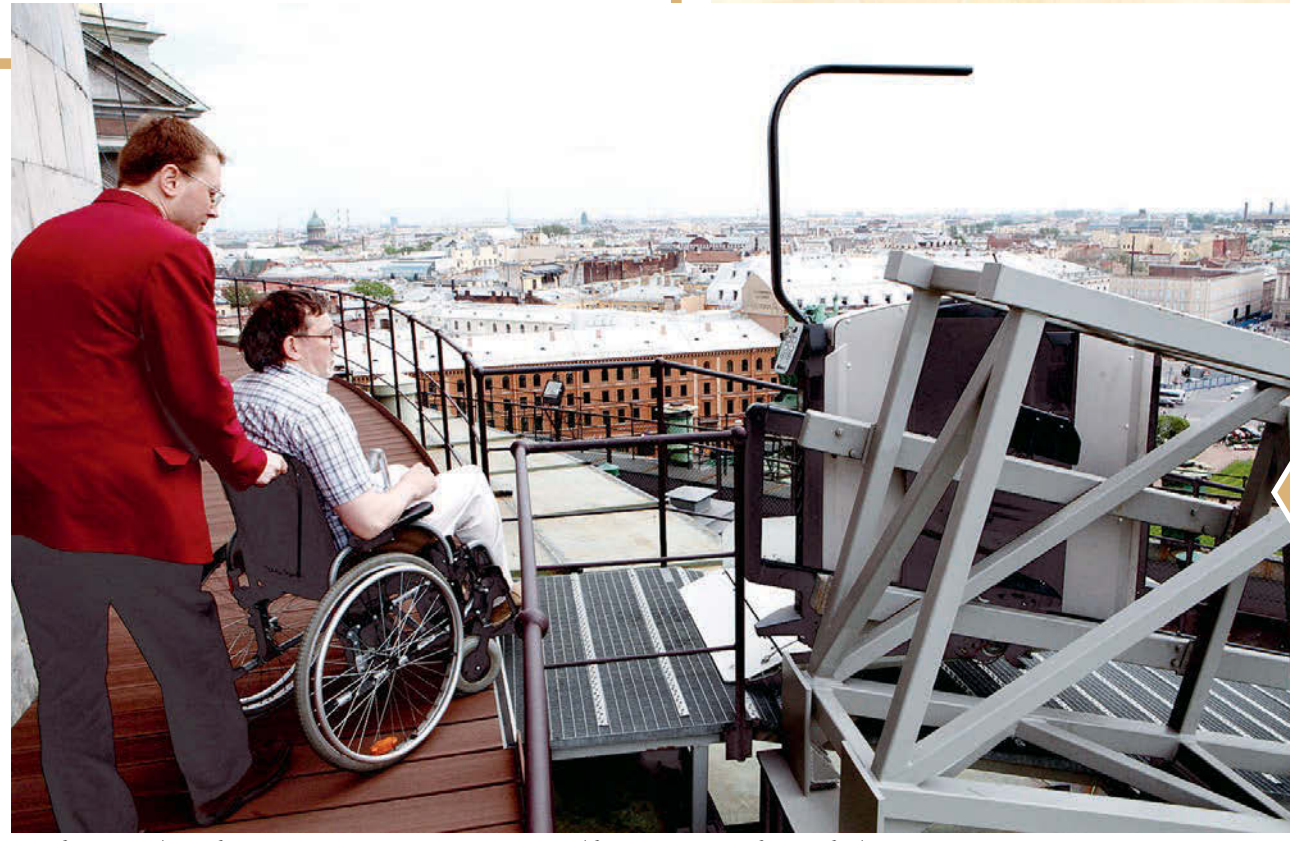
Ни один музей города не может похвастаться такой доступностью для людей с ограниченными возможностями, как Исаакиевский собор.