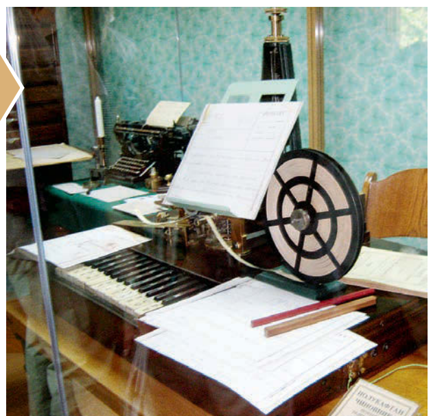
ГМЗ «Петергоф». Музей «Императорский телеграф» — один из самых популярных среди маленьких посетителей музейного комплекса.

«Петергоф» рассказал о проекте возрождения в стране школьного туризма, который поддерживает, и прежде всего финансово, Министерство культуры. С июля по октябрь 840 детей из разных регионов страны приезжали на четыре дня в Петергоф и по специальной программе знакомились с музеями и парками, если на эти дни выпадали петергофские праздники — участвовали и в них. Первоначально предполагалось, что это будут дети — победители творческих конкурсов из продвинутых школ: аудитория подготовленная. Но дети приезжали самые разные, большинство из них в Петергофе прежде никогда не бывали, да и вообще первый раз в жизни покидали родные города и поселки. Сотрудники «Петергофа» заметили, что в первый день подросткам было явно неинтересно — не привыкли к музейным пространствам, а в европейских музеях многие никогда не бывали, надо было сделать так, чтобы слово «музей» перестало ассоциироваться со словом «скука». Поэтому ребята погружали в быт малых петергофских дворцов, показывали в Музее императорского телеграфа, как в позапрошлом веке и в начале минувшего без всяких эзэсок можно было передать информацию, и т. д.