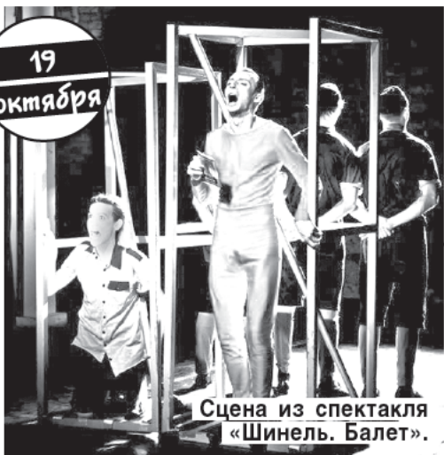
Сцена из спектакля «Шинель. Балет».