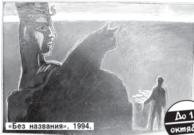
«Без названия». 1994.