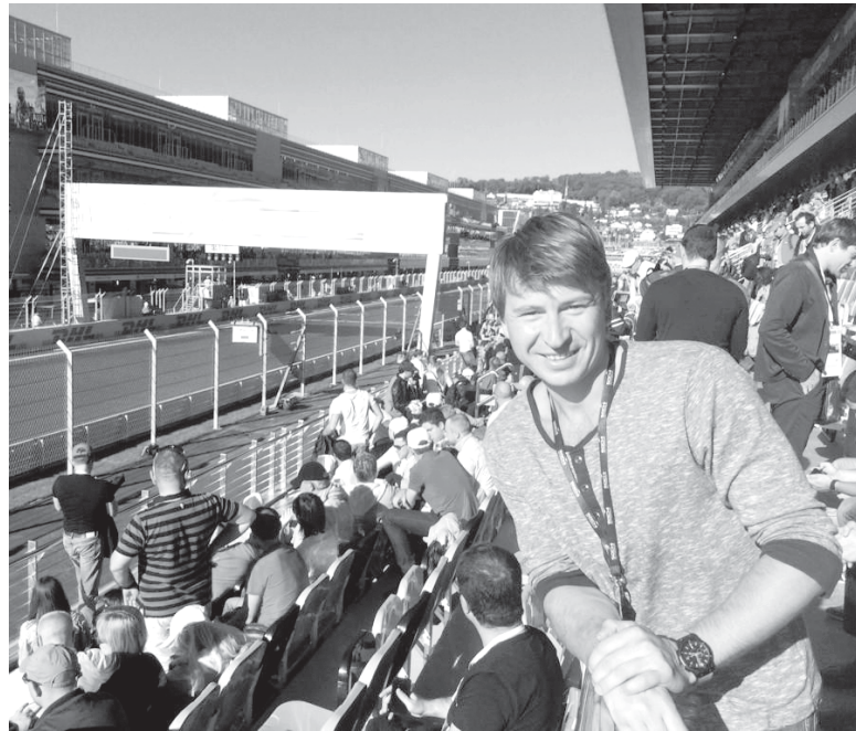
Алексей Ягудин на уже ставшей знаменитой сочинской трассе.

— Кстати, я больше не хочу, чтобы сборную моей страны тренировал Фабио Капелло, — вступил с ним в диалог известный телекомментатор Василий Уткин