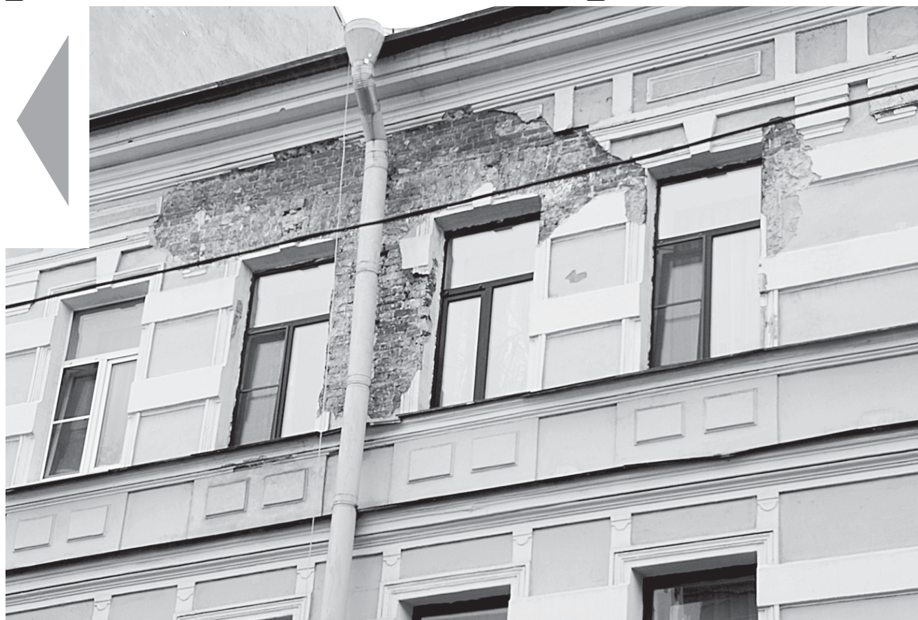
Фасад этого дома можно заметить издали.