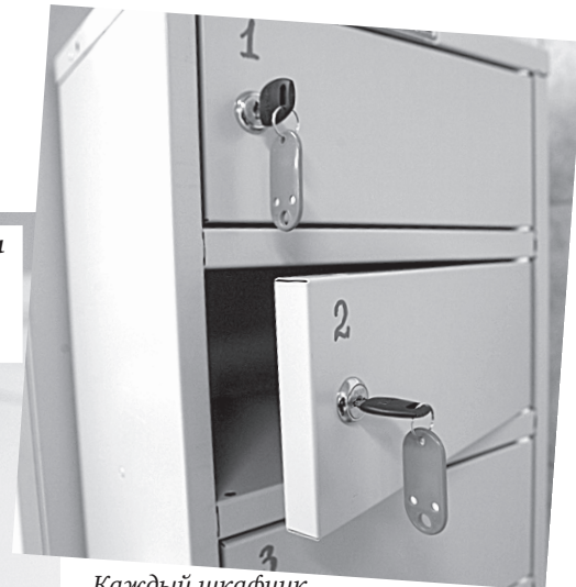
Каждый шкафчик запирается на ключ.

Банщик Володя ходил между двух парных, вымеривал что-то.