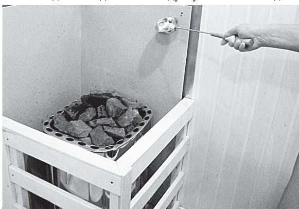
Сауна разогревается до 94 градусов.

— А ну пойдём... ковшик возьми. Верни только.