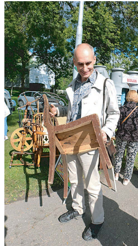
Стул XIX века — настоящая находка.

Жизнь людей, взявших на себя ответственность за эти дома, облет-