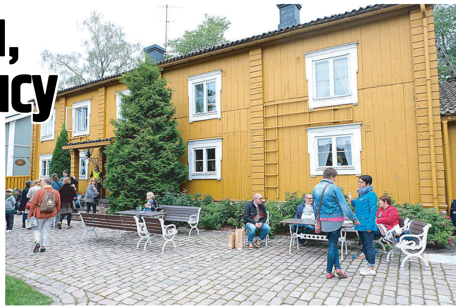
Дом с пиялестрами в Старом городе.