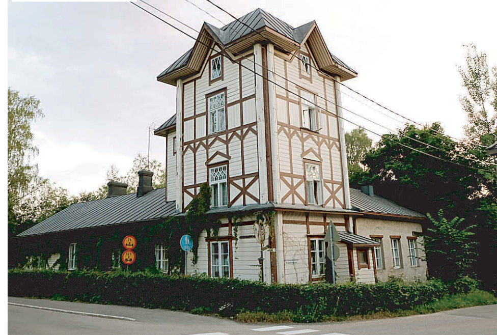
Дом-башня — бывшая винодельня XIX века.