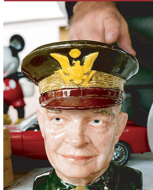
Кружка с портретом Эйзенхауэра — покупка для любителя.