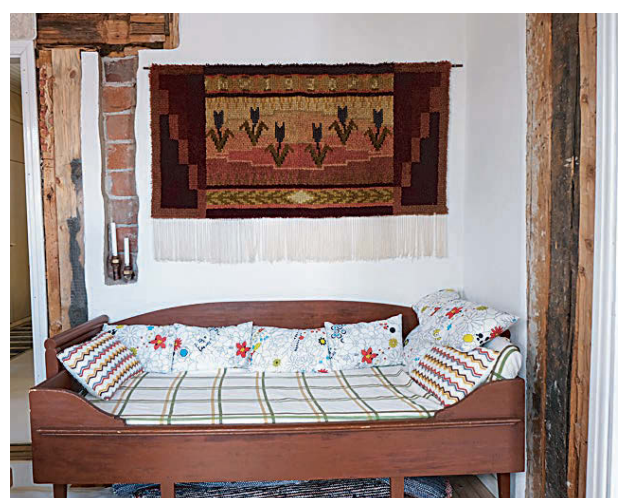
Традиционные вещи: деревянная кровать и коврик рюйю.

— Когда эта история начиналась 10 лет назад, никто не предполагал, что она приобретет такой масштаб, — рассказывает моя спутница. — Сегодня посмотреть на старые дома Ловиисы приезжают туристы из разных городов Финляндии, Эстонии, России. Это событие делает наш город более популярным и приносит свои дивиденды. Вырученные средства идут в казну города, часть — на восстановление старых домов.