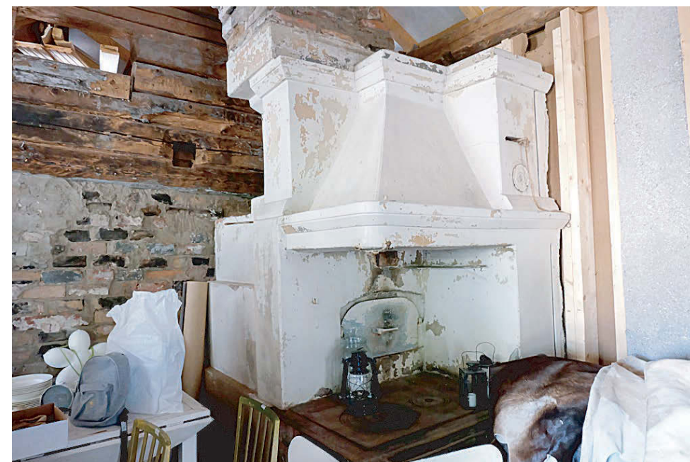
Ремонт старинных домов — дело непростое.