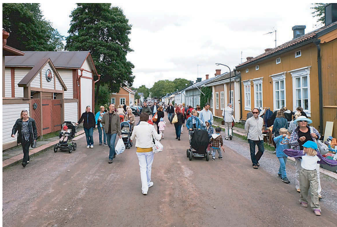
Поток людей путешествует от одного старинного дома к другому.

Торговля идет на улицах, на центральной площади, у распахнутых дверей домов, даже местная гимназия оккупирована в эти дни торговцами. Но главное событие — дни