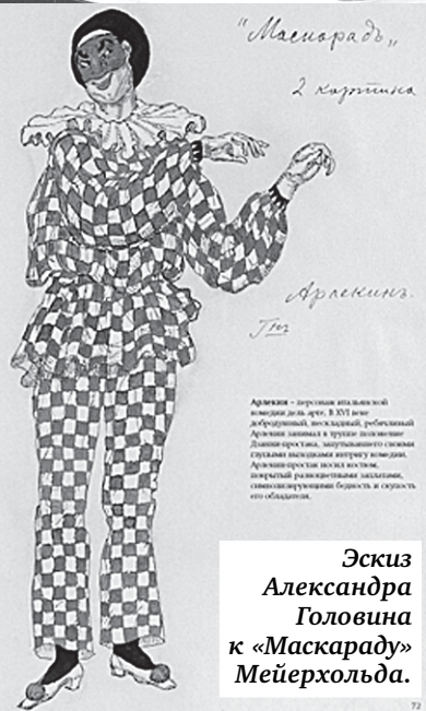
Эскиз Александра Головина к «Маскараду» Мейерхольда.