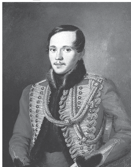
Петр Заболотский. Портрет Михаила Лермонтова. 1837.